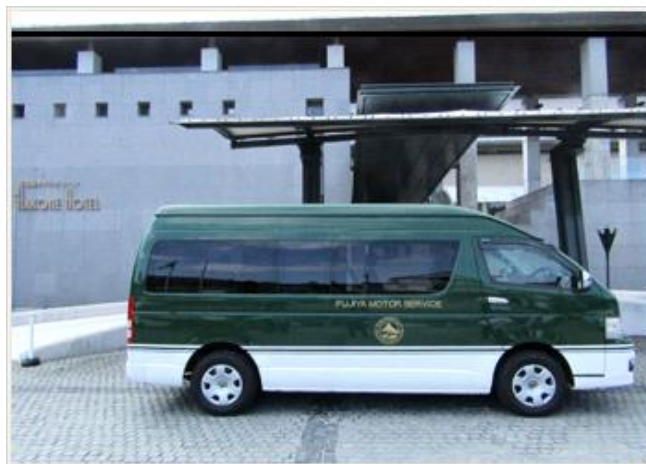
緑色の富士屋カラーが目印です