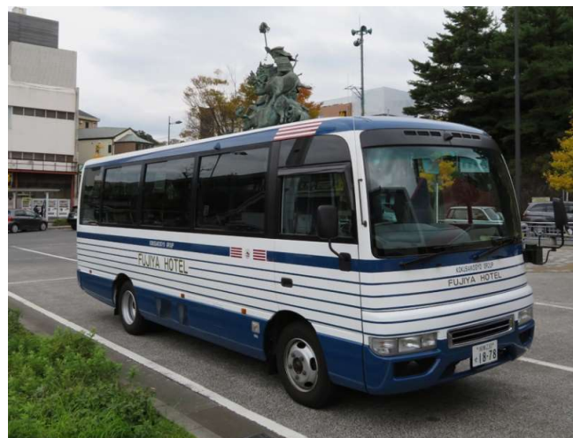
青と白のボーダーが目印です